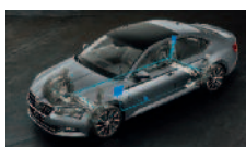
Adaptivní podvozek – volitelné nastavení podvozku ve 3 režimech (Comfort, Normal, Sport)

ŠKODA usnadňuje život svým zákazníkům každý den.