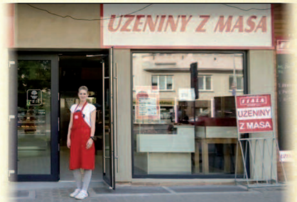
Trída V. Klementa 1227, Mladá Boleslav tel. 778 766 897