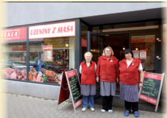
Železná 49, Mladá Boleslav tel. 739 029 553

Těšíme se na Vás v našich prodejnách v Mladé Boleslavi: